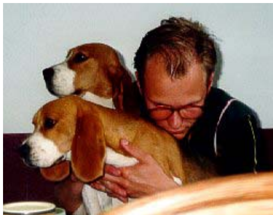
I færd med at læse korrektur på vores hvalpehæfte