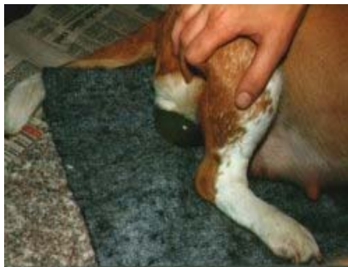
Vi er sammen med tæven under opblokningen

Når temperaturen går under de 37 grader, er vi klar til at "modtage" hvalpe. En af os er hele tiden er tæt ved tæven, så hun føler sig tryk og rolig. Da hvalpene trykker på blæren og maven, har tæven brug for at komme ud ret ofte. Typisk vil tæven ikke spise de sidste timer op til fødslen og ofte "tømmer hun sig helt af" før fødslen ved at kaste op og tømme blære og tarm. På den måde er det lettere for tæven at kunne presse optimalt.